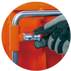
ハンドルストッパー！