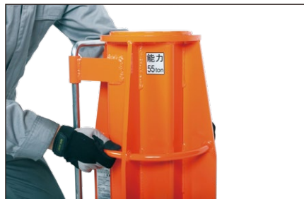
■ 取っ手付きで位置決めもラク！